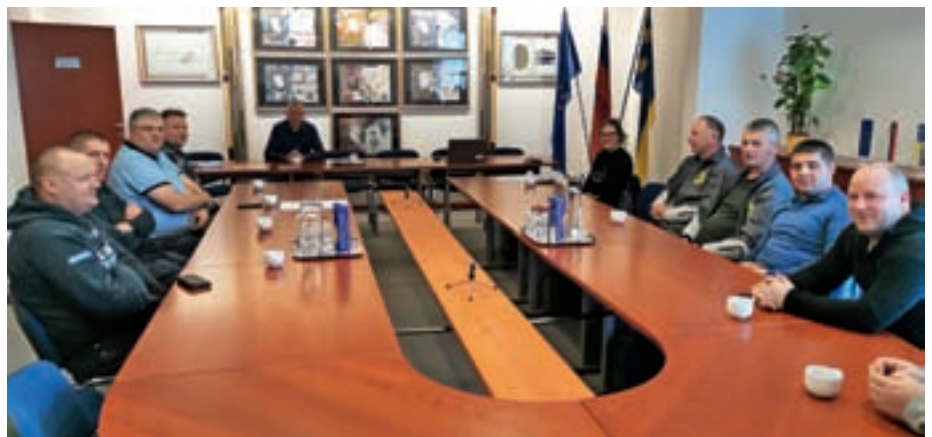
Predsedniki in poveljniki vseh štirih gasilskih društev ter poveljnik gasilskega poveljstva Žiri pri županu / Foto: Gregor Mlinar

občina gasilsko aktivnost izjemno ceni in da se zaveda, da so gasilci tisti, ki vedno priskočijo na pomoč. Predstavniki društev so predstavili svoje načrte za letošnje leto in poudarili, da si želijo večjo podporo občine. Na koncu srečanja jim je župan zaželel uspešno in mirno leto z malo intervencijami ter veliko uspešnih družabnih dogodkov in srečanj.