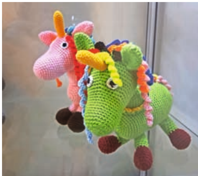
V razstavni vitrini v knjižnici si je mogoče v februarju ogledati izdelke dolgoletne in zveste bralke Brigitte Žakelj.

Svoj prosti čas rada nameni vnukom, rada sede na kolo, prebira knjige in peče piškote. Zelo rada pa tudi kvačka. Tako pod njenimi prsti nastajajo čudoviti unikatni izdelki, razne figurice, živalce, odejice, copatki, kapice, rokavičke za malčke, za večje pa kape trakovi, šali, rokavice. Z veseljem se loti tudi kvačkanja puloverja, ponča, bufa ali ogrinjala. Vsaka od njenih kreacij je edinstvena, zato lepo vabljeni, da si do konca februarja ogledate razstavo kvačkanih ročnih izdelkov v razstavni vitrini v Krajevni knjižnici Žiri.