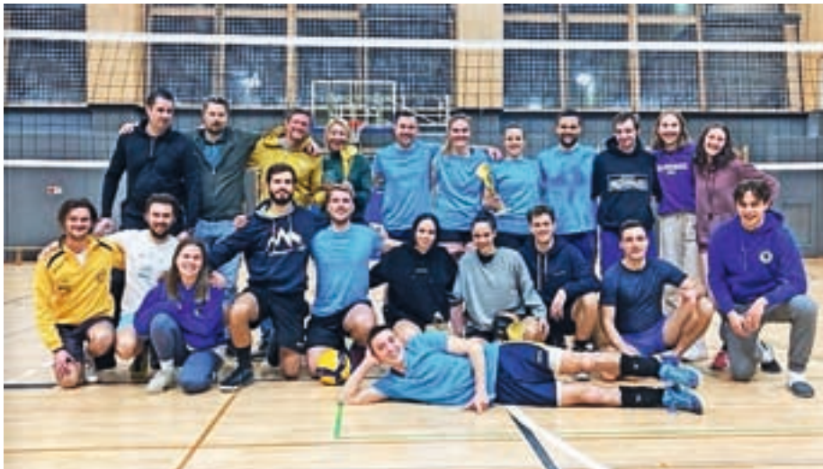
Najboljše tri ekipe na Prednovoletnem turnirju v odbojki Žiri 2022

Enajst tekmovalnih ekip, željnih zmage in dobre igre, je – pravijo organizatorji – poskrbelo, da je bila predzadnja decembrska nedelja v Športni dvorani Žiri izjemno napeta, vse ekipe pa so v borbenem in športnem duhu pokazale, kaj znajo in zmorejo. Na najvišjo stopničko je ob koncu dneva kot zmagovalka Pred-