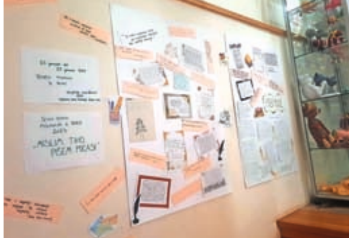
V Krajevni knjižnici Žiri so se letos že drugo leto zapored pridružili akciji Teden pisanja z roko.

Krajevna knjižnica Žiri letos že drugo leto sodeluje z Društvom Radi pišemo z roko, ki je letos že osmo leto zapored organiziralo akcijo Teden pisanja z roko. Akcija je potekala od 23. do 27. januarja, letošnja nosilna tema pa je bila Mislím tiho, pišem počasi .