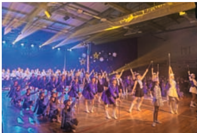
Letošnjo pustno povorko bodo popestrile tudi Trebanjske mažoretke.

Turistično društvo Žiri v sodelovanju z Občino Žiri tudi letos organizira že tradicionalno Pustno povorko, ki bo na pustno soboto, 18. februarja, z začetkom ob 14. uri. Vse maškare, male in velike, se bodo zbrale na parkirišču pred Zadružnim domom. Zabavni program, ki so ga pripravile Pike Nogavičke iz VVE pri OŠ Žiri, se začne ob 14. uri. Nastopu gostujoče skupine v organizaciji Pihalne godbe Alpina Žiri in nastopu posebnih gostij Trebanjskih mažoretke sledi pustna povorka. Maškare se bodo sprehodile po glavni cesti od Zadružnega doma do trgovine Market Spar in nazaj do parkirišča pred Zadružnim domom. V pustni povorki bodo poleg maškar sodelovale tudi Pike Nogavičke, pihalna godba in mažoretke. Po vrnitvi nazaj na parkirišče seveda sledi še zabavni program, sladkanje s krofi, bomboni in sladko peno, ne bo pa manjkalo niti pokovke in toplega čaja.