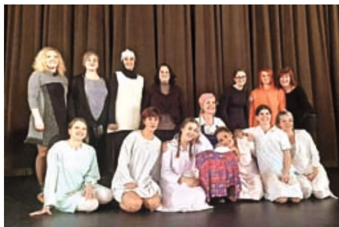
Ustvarjalne vzgojiteljice iz predstave Kdo je napravil Vidku srajčico / Foto: arhiv vrtca

Zgodbo o dobrosrčnem in prijaznem štiriletniku iz revne družine, ki se mu je s pomočjo živali uresničila največja želja – dobiti svojo čisto novo srajčico, so žirovske vzgojiteljice prvič odigrale decembra kot novoletno predstavo, s katero vsako leto poskrbijo za prijetnejši zaključek leta ob obisku dedka Mraza. Predstavo je soustvarjalo 15 strokovnih sodelavk vrtca, ki so vaje od dva- do trikrat tedensko začele že v začetku novembra in same poskrbele za celotno kostumsko, scensko