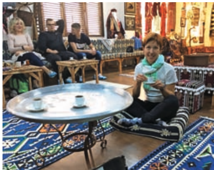
Utrinek iz t. i. kulturne sobe

Šport in vsakršno športno udejstvovanje je pri nas zelo pomembno, če že ne obvezno. Veliko denarja namenjamo špor-