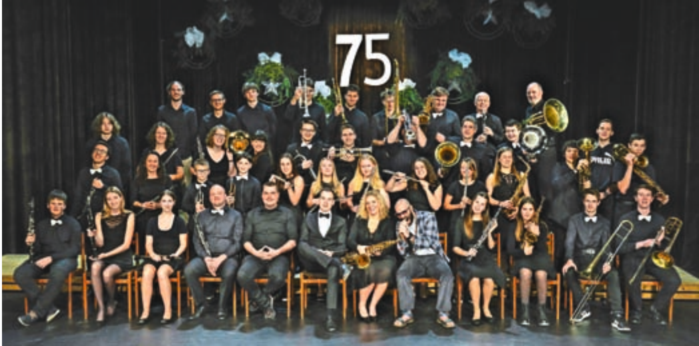
Pihalni orkester Alpina Žiri