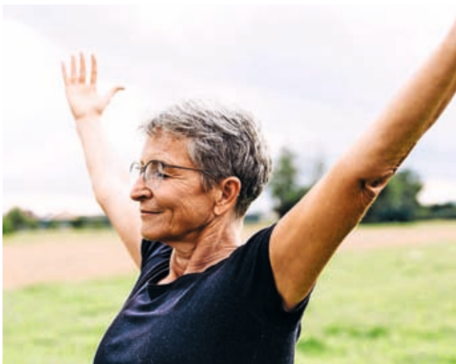
S pametno skrbjo za svoje zdravje pomagamo tudi bližnjim k boljšemu zdravju.

Glavni je celostno gledanje na človekovo zdravje; torej spoznanje, da je zdravje kakovostno delovanje vseh človekovih razsežnosti v neločljivi medsebojni povezanosti. Ko so v opredelitvi zdravja izrecno omenili duševno in socialno blagostanje, se je pozornost razširila s telesne razsežnosti tudi na duševno, duhovno, socialno, razvojno in bivanjsko. Drugi razlog tiči v tem, da je celostna opredelitev zdravja pozornost zdravstva, politike in ljudi usmerila z