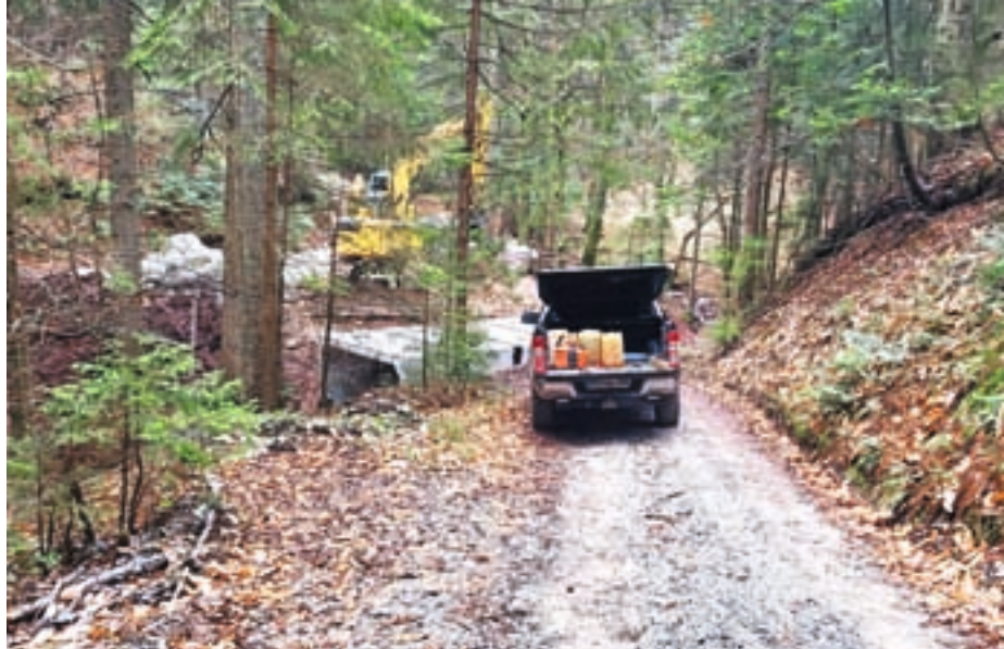
Novi most v Žirovskem Vrhu

V Žirovskem Vrhu so stari dotrajani most nadomestili z novim.