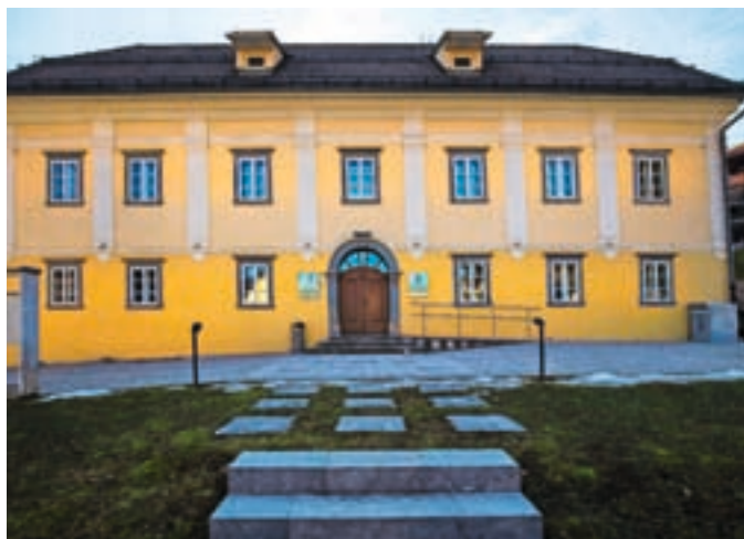
Ob dnevu turističnih vodnikov vabijo na brezplačen voden ogled čevljarske in čipkarske zbirke v Muzeju Žiri.

Turistično društvo Žiri tudi letos aktivno sodeluje z Razvojno agencijo Sora. V sklopu dogodkov ob dnevu turističnih vodnikov bo v Muzeju Žiri v torek, 21. februarja, od 15. do 18. ure možen brezplačen voden ogled čevljarske in čipkarske zbirke. Poleg ogleda zbirke bosta obe tradicionalni obrti predstavljeni tudi v živo, saj bodo poleg turističnega vodnika prisotni tako čevljar kot klekljarice. Vsi lepo vabljeni.