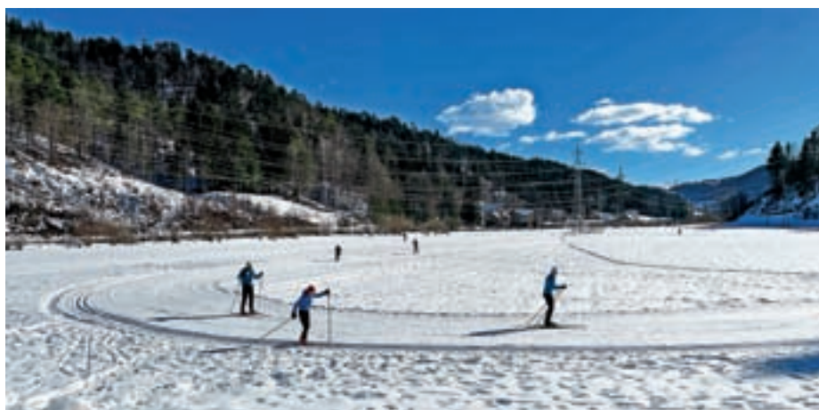
Urejene tekaške proge v Račevi

Letošnja nekoliko debelejša snežna odeja je omogočila ureditev tekaških prog tudi v Žireh. V Račevi je za urejene proge poskrbel Smučarski skakalni klub Norica Žiri, v Brekovicah Miha Mlinar s svojo ekipo, krajani sami pa so uredili še proge na Ledinici pod cerkvijo sv. Ane.