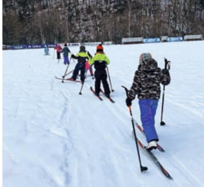
Zimsko veselje – tek na smučeh

V duhu medgeneracijskega sodelovanja, ki ga v Vrtcu Žiri skrbno negujejo in vključujejo v svoj program, so najmlajši leto začeli s posebnim obiskom v SeneCura Domu starejših občanov Žiri. Na obisk doma so se z vzgojiteljicama Živo in