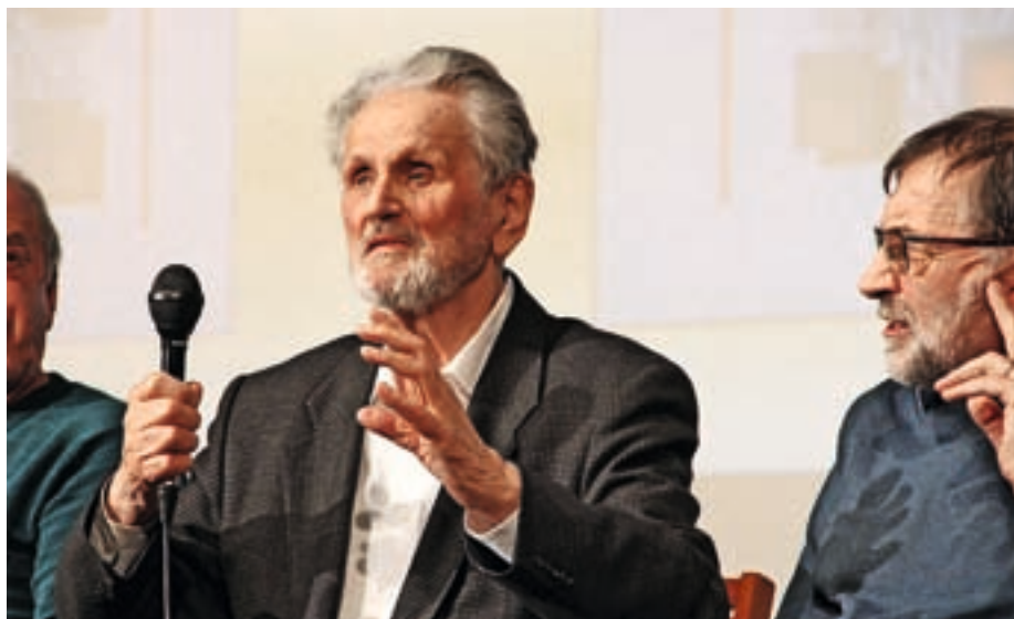
Urednik Zdravko Mlinar

Ob predstavitvi zbornika so poudarili dve posebnosti. »Prva je ta, da za razliko od večine krajevnih zbornikov, urejenih po formuli 'od paleolita do Tita', ne povzema le zemljepisnih, zgodovinskih in drugih domoznanskih posebnosti, da ni zazrt le v preteklost, ampak se osredotoča na aktualna vprašanja in skuša na ta način prispevati tudi k reševanju problemov.« Druga posebnost pa je ta, da poskuša udejanjiti ta čas v svetu zelo aktualno paradigmo občanskega raziskovanja (citizen science). »Akademik Zdravko Mlinar je kot prvi v Sloveniji opozoril na mednarodno gibanje za občansko raziskovanje in znanost in večjo odprtost znanstvenih raziskav. V pripravah na izid te knjige je v Žireh spodbudil širok krog ljudi, da so opisali svoje nepoklicno raziskovanje, izkustveno znanje in možnosti, ki jih tovrstno udejstvovanje odpira. Hkrati pa je k sodelovanju pritegnil celo vrsto uglednih poklicnih raziskovalcev iz cele Slovenije.« Pri knjigi, ki je nastajala skoraj dve leti, s svojimi avtorskimi članki sodeluje okrog devetdeset avtorjev, če dodamo še skupinske soavtorje, pa je vseh okrog 150, so pojasnili v predstavitvi zbornika. Zbornik v dveh delih so zato označili za žirovski opus magnum – največje