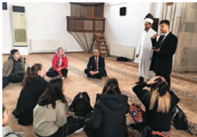
Obisk ene izmed 58 mošej v Bolvadinu

tnim objektom, rekvizitom in opremljenosti. V Turčiji ni tako. Na šoli gostiteljici telovadnice sploh nimajo (pa je to ena boljših srednjih šol), imajo pa prostor za namizni tenis, šah in pikado. Tudi šolskih stadionov ni, igrišče za nogomet je kar neasfaltirani del parkirišča (žoga je fantom pogosto zletela na ravnateljev avto), odbojko pa igrajo pred glavnim šolskim vhodom, kjer je položenih nekaj tlakovcev. Pa se nihče ne pritožuje nad razmerami, še več, njihova igra je sproščena in polna smeha. Seveda o kakšnih športnih oblačilih nihče ne razmišlja. Dekleta so tudi tu pokrita s hidžabi (rutami). Za konec še to: Ste že slišali za hemsball? Veste, da je to športna disciplina, ki se je razvila v Turčiji? Mi smo imeli priložnost, da smo jo поблиže spoznali in se v njej tudi preizkusili. Prav zabavno je bilo. Za nami je torej še eno čudovito doživetje sveta, ki je precej drugačen od našega, evropskega. V marsičem bi se lahko mi, moderni zahodnjaki, zgledovali po njih.