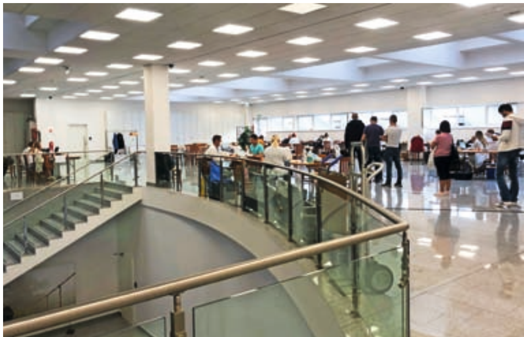
Prva letošnja krvodajalska akcija v Žireh

S sredstvi, ki jih zberemo s članarino in prispevki Občine Žiri ter dobrotnikov, lahko nudimo razne oblike humanitarne in socialne pomoči. Od aprila lani na različne načine pomagamo tudi ukra-